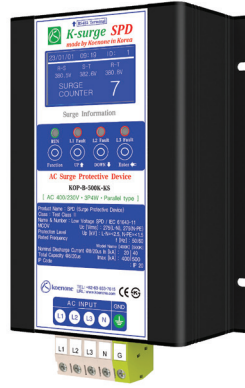
제품리스트 B-2 (W)140 x (L)216 x (H)90