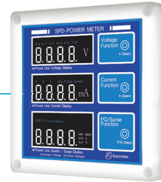
SPD Power Meter