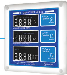
SPD Power Meter