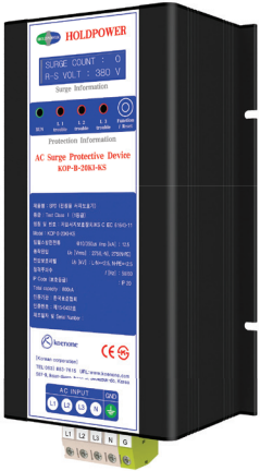
제품리스트 A-2 (W)140 x (L)276 x (H)90