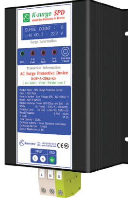
제품리스트 A-3 (W)140 x (L)226 x (H)90