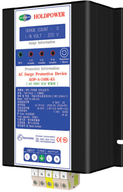
제품리스트 B-1 (W)140 x (L)216 x (H)70