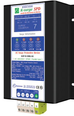
제품리스트 B-2 (W)140 x (L)216 x (H)90